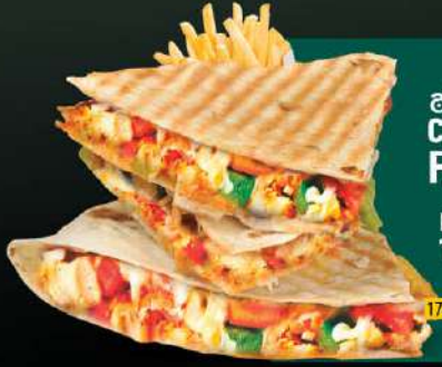
فانتاسيا دجاج CHICKEN FANTASIA