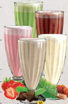
تمر DATES Dhs. 8/10/12