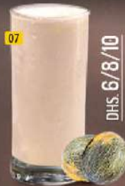
07 شمام SWEETMELON