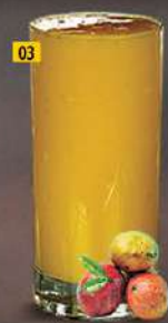
03 مانجو MANGO