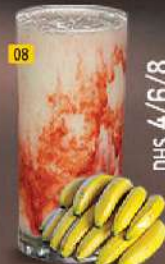
08 موز BANANA