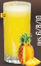
12 أناناس PINEAPPLE