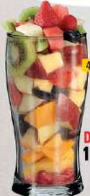
DHS 15/20 صحن سلطة فواكه FRUIT SALAD PLATE