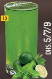
10 ليمون نعناع LEMON MINT