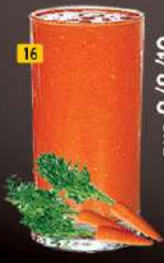
16 جزر CARROT