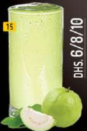
15 جوافة GUAVA