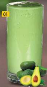
01 أفوكادو AVOCADO

FOOD SHOULD MAKE YOU FEEL PRETTY FROM THE INSIDE OUT.