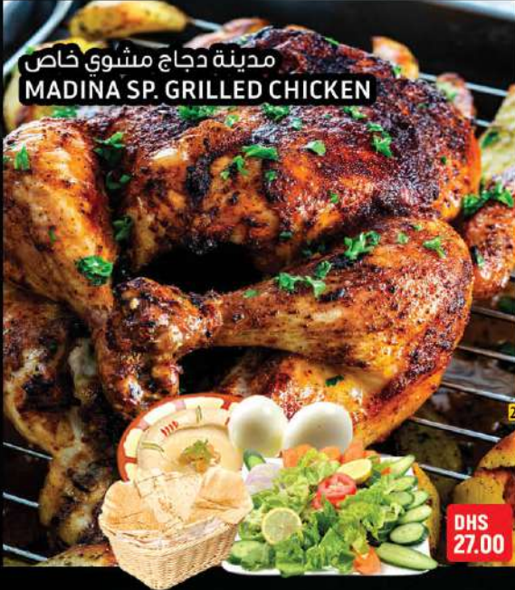
مدينة دجاج مشوي خاص MADINA SP. GRILLED CHICKEN

BARBECUE OR BARBEQUE (INFORMALLY BBQ IN THE UK, U.S. AND CANADA, BARRIE IN AUSTRALIA AND BRAAI IN SOUTH AFRICA) IS A TERM USED WITH SIGNIFICANT REGIONAL AND NATIONAL VARIATIONS TO DESCRIBE VARIOUS COOKING METHODS WHICH USE LIVE FIRE AND SMOKE TO COOK THE MEAT.