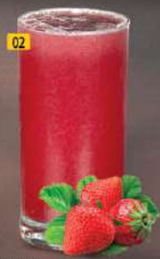
02 فراولة STRAWBERRY