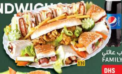
كلوب عائلي FAMILY CLUB