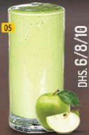
05 تفاح APPLE