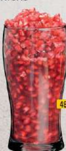
قطع بطيخ WATERMELON BRICKS DHS 10/12