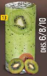
13 كيوي KIWI