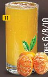
11 برتقال ORANGE