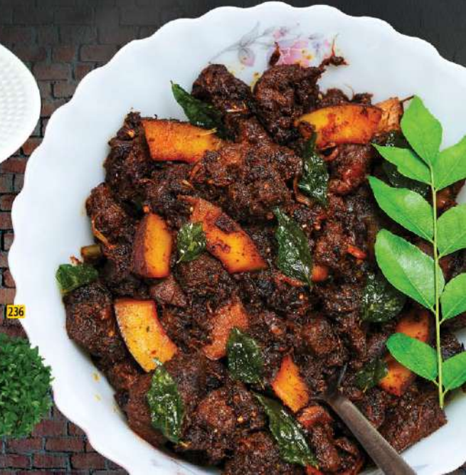
لحم بقر مقلي BEEF FRY