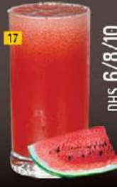
17 بطيخ WATERMELON