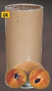
04 شيكو CHICKOO