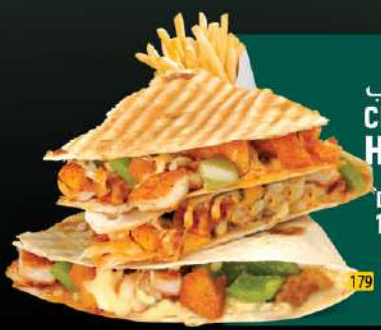
دجاج هاي توب CHICKEN HIGH TOP