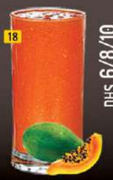
18 بابايا PAPPAYA