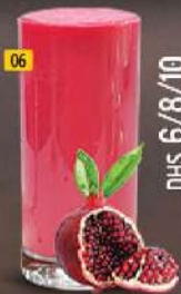
06 رمان POMEGRANATE