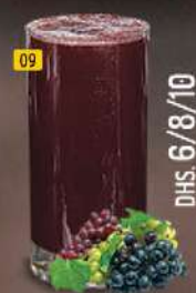
09 عنب GRAPE